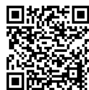
Beispiel einer Panorama-Tour: Klick